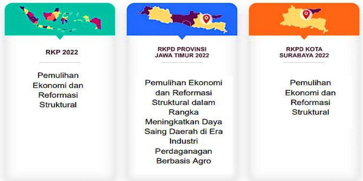
Gambar 3.1 Bagan Kesesuaian Tema Pembangunan Kota Surabaya dengan Provinsi Jawa Timur dan Nasional

Sinergitas Program Kota Surabaya dengan Prioritas Pembangunan Provinsi Jawa Timur dan Prioritas Pembangunan Nasional tersaji dalam tabel-tabel sebagai berikut.